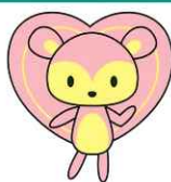
「まもりすまい保険」の“まもりす”