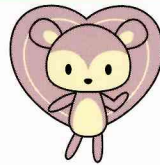
「まもりすまい保険」の“まもりす”